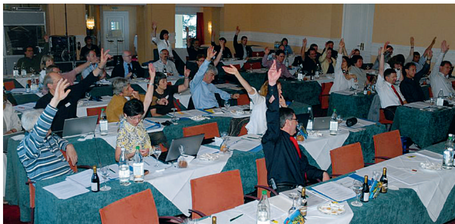
Un moment historique au Bürgenstock: le 9 mai 2009, les médecins de famille décident à l'unanimité de lancer l'initiative populaire «OUI à la médecine de famille».

Lors du séminaire annuel des cadres SSMG au Bürgenstock, les médecins de famille ont décidé de lancer, à l'automne 2009, une initiative populaire «OUI à la médecine de famille». Le comité d'initiative sera exclusivement composé de médecins de famille.